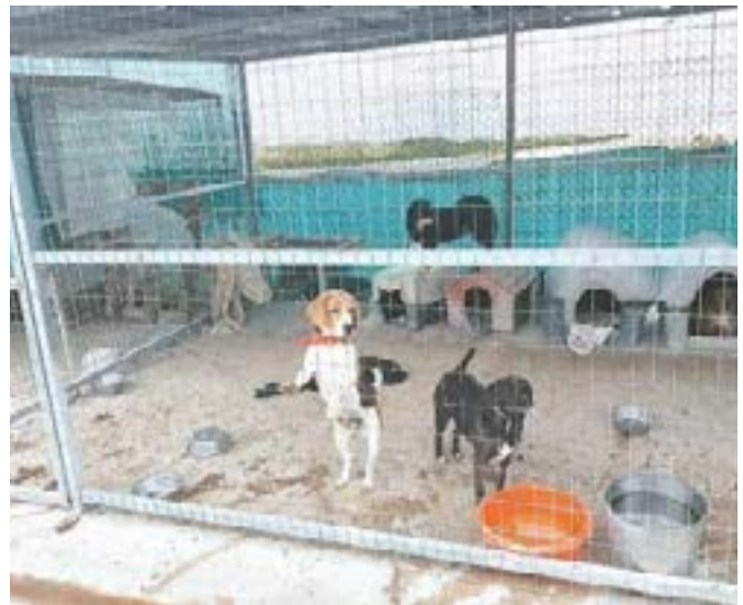
Εικ. 3: Η ζωή στα καταφύγια

Υπεύθυνη Καθηγήτρια: Ιφιγένεια Αντωνίου, Καθηγήτρια Βιολογίας (Αντικαταστάτρια Μαρίας Λουκά)