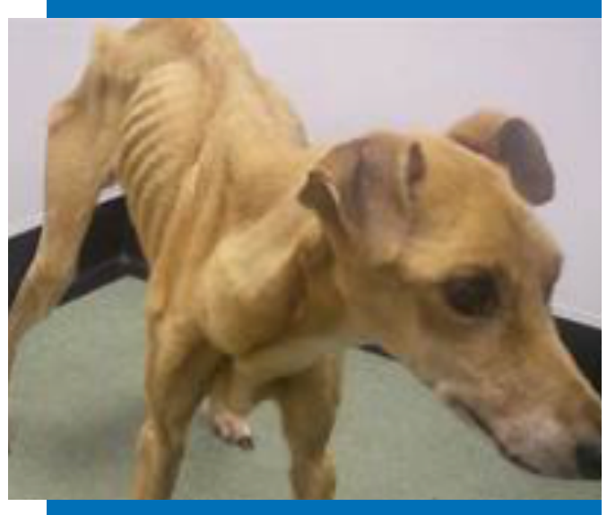
Εικ. 2. Σκυλί που εγκαταλήφθηκε αβοήθητο να πεθάνει από την πείνα