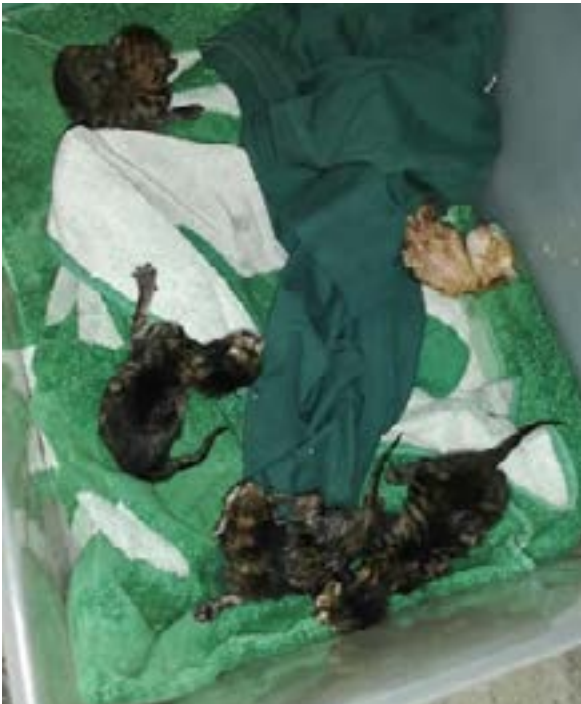
Εικ. 1: Παρατημένα νεογέννητα γατάκια που βρέθηκαν σε κάδους απορριμμάτων