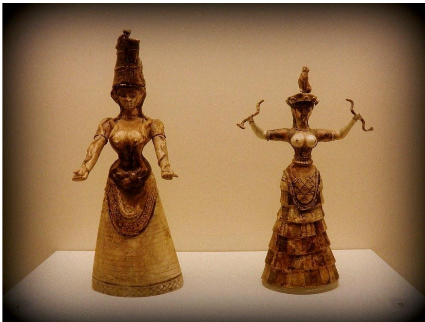
Η αρχαία Θεά και η Θεά των όφεων (φιδιών)

N. Τζώρτζογλου, Όταν οργίζεται η γη, σελ. 124-125 (με μικρές αλλαγές)